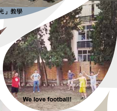
We love football!