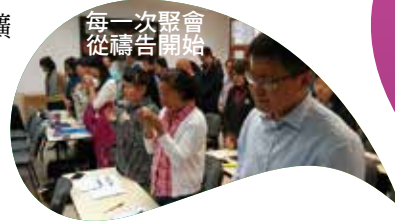
每一次聚會從禱告開始