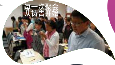
每一次聚会从祷告开始