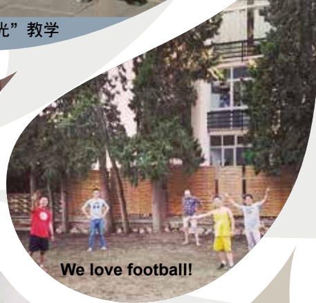
We love football!