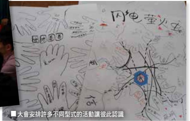
■ 大會安排許多不同型式的活動讓彼此認識