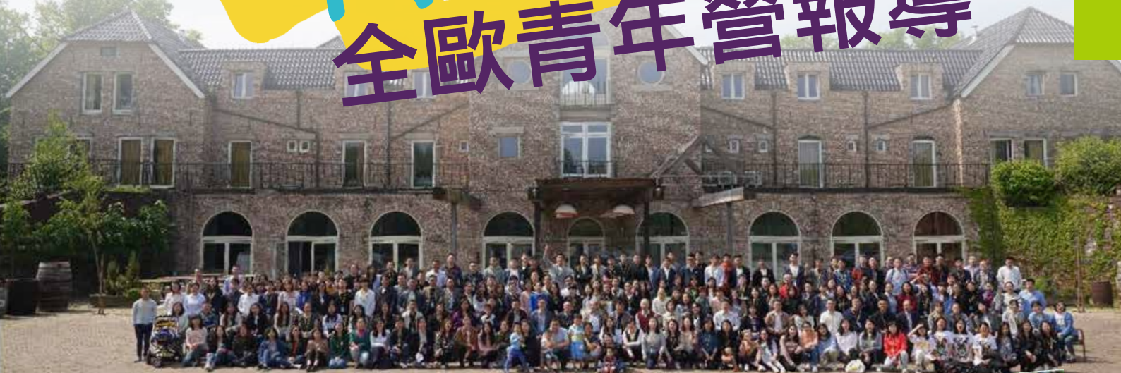
■ 此次青年營吸引來自歐洲7個國家，27間教會的200餘位年輕信徒，加上19位牧者和神學院老師同工。

國 際歐華神學院和荷蘭華人基督教會首次聯手舉辦的全歐青年營，五月中旬於荷蘭和德國交界的小鎮Venlo登場。三天活動吸引了來自歐洲各地的華人教會，約230位神的兒女齊聚一堂，盼望將天父長闊高深的愛澆灌在歐洲各地的年輕人心中，讓他們更多地經歷到神的豐富與信實。