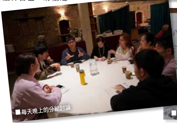
■ 每天晚上的分組討論