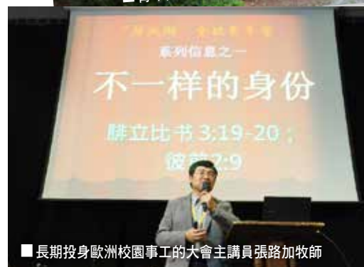
■ 長期投身歐洲校園事工的大會主講員張路加牧師