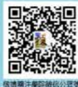
敬請關注學院雜誌公眾號