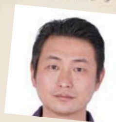
神学学士科 / 关键