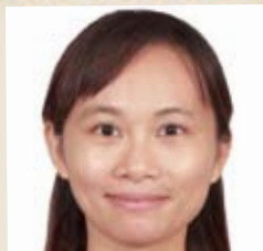
道学硕士科 / 区卿仪